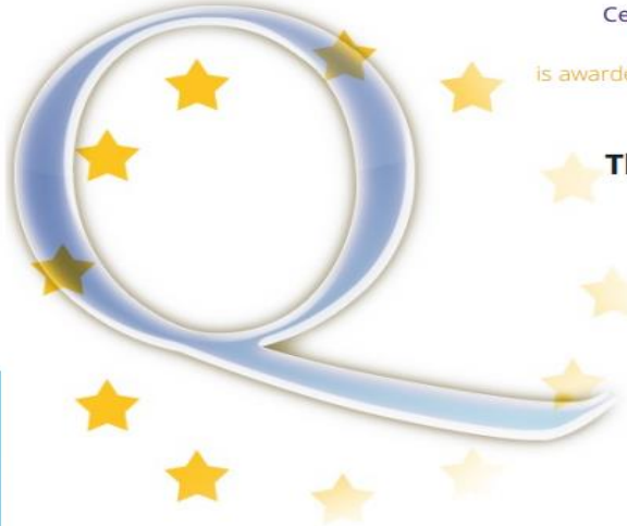
Mehmet Fatih Döğür Ulusal Destek Servisi Türkiye